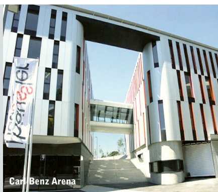
Carl Benz Arena